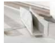
Coppia 2016 marmor in les/marmo e legno 57 x 14 cm