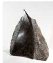
Senza titolo, 2003 črn kamen/pietra nera 37 x 42 cm 8.000 €