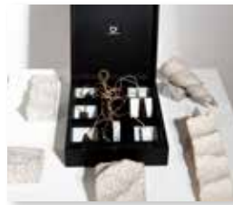
Monili nakit iz kamna, marmorja, školjk/ pietre, marmi, conchiglia e cordoncino Onde ( 5 ) e conchiglia istrski kamen/pietra d' Istria od 120 do 340 €