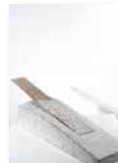
Vento, 2010 kraški in istrski kamen/ pietra del Carso e pietra d' Istria 65 x 20 cm 4.600 €