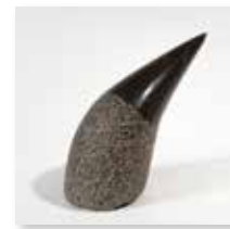
Corno, 2003 kraški kamen/pietra del Carso 20 x 12 cm 2.000 €