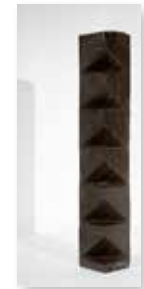
Omaggio a Brancusi 2016 črn marmor/marmo nero 50 x 10 cm 2.700 €