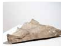
Onde, 2008 kraški kamen/pietra carsica 35 x 45 cm 1.950 €