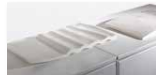
Vibrazioni ( 2 ) 2016 marmor Carrara/ marmo di Carrara 57 x 35 cm