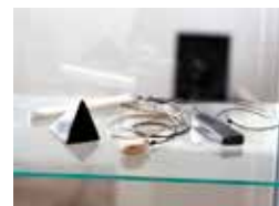
Al centro nella teca Monili kamen, marmor, školjka /pietre, marmi, conchiglia e cordoncino