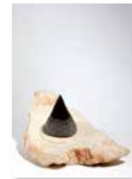
Nascita di rinoceronte , 2004 kraški in istrski kamen/ pietra del Carso e pietra d' Istria 45 x 20 cm 3.700 €