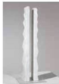
Vibrazioni, 2016 marmor Carrara/marmo di Carrara 55 x 12 cm 2.400 €