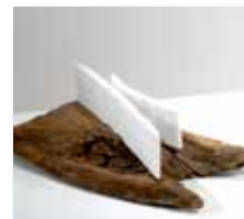
Coppia, 2015 marmor in les/marmo e legno 40 x 22 cm 1.290 €