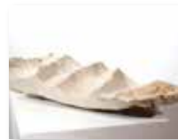
Onda, 2008 istrski kamen/pietra d' Istria 75 x 32 cm 1.500 €