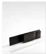
Coppia, 2016 črn marmor/marmo nero 45 x 10 cm