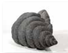
Conchiglia, 2008 barvan istrski kamen/pietra arenaria dipinta 40 x 23 cm 2.900 €