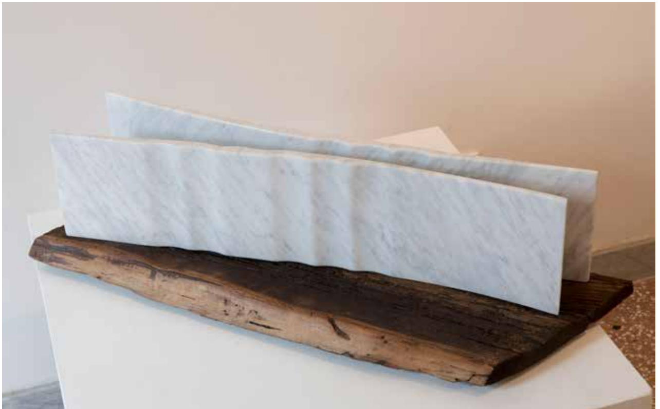
Coppia, 2015, marmo Carrara e legno/marmor Carrara in les, 17x116x23cm