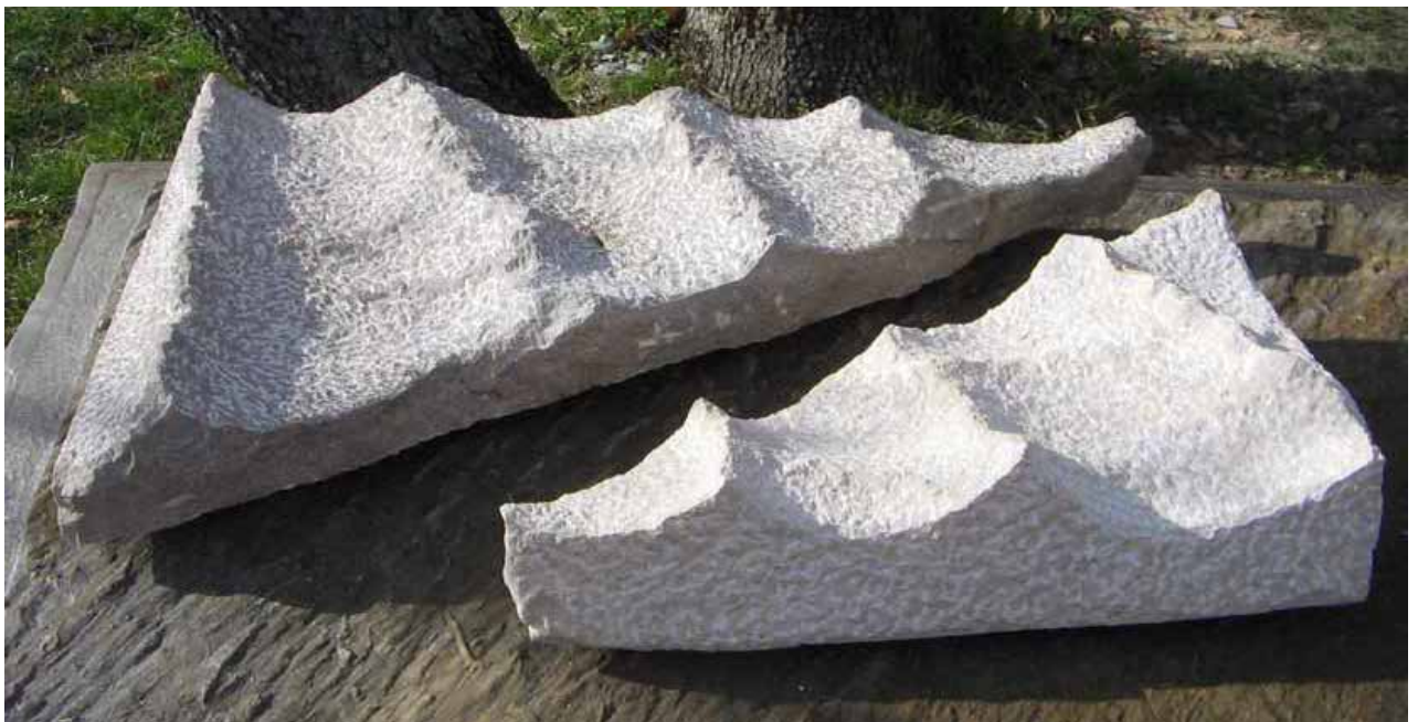
Onde, 2008, (40 x 60 x 12 cm)