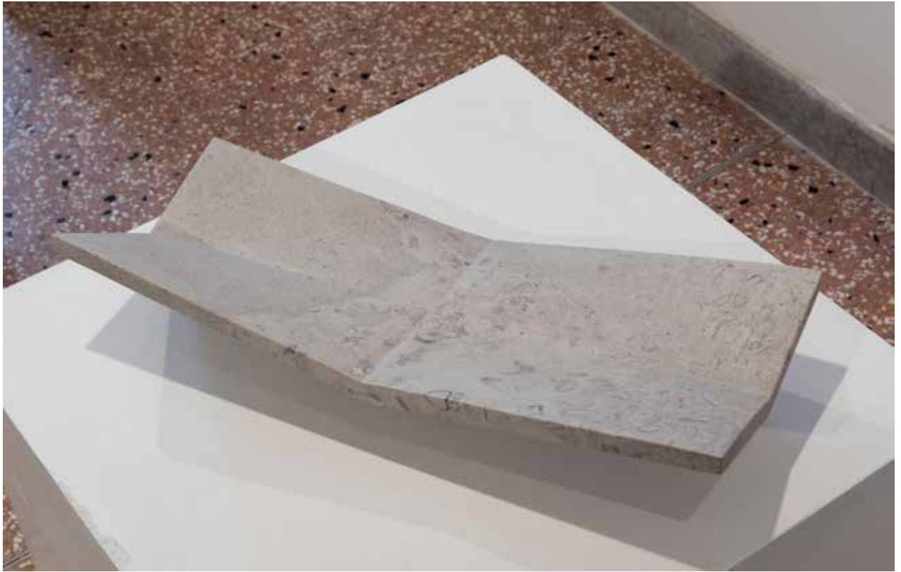
Bora n. 3, 2018, pietra di Lipizza e vetro/ lipiški kamen in steklo , 50x12x20cm