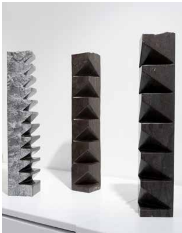
Omaggio a Brancusi, 2016, marmo / marmor, 51x8x8cm Omaggio a Brancusi n.5, 2016, marmo / marmor, 50x9x9cm Omaggio a Brancusi n.6, 2016, marmo / marmor, 50x9x8cm

Alla fine del XX secolo e soprattutto nel XXI secolo, la nostra società ha trascurato, forse addirittura scartato ed eliminato, l'infinito dalle sue idee. Anche