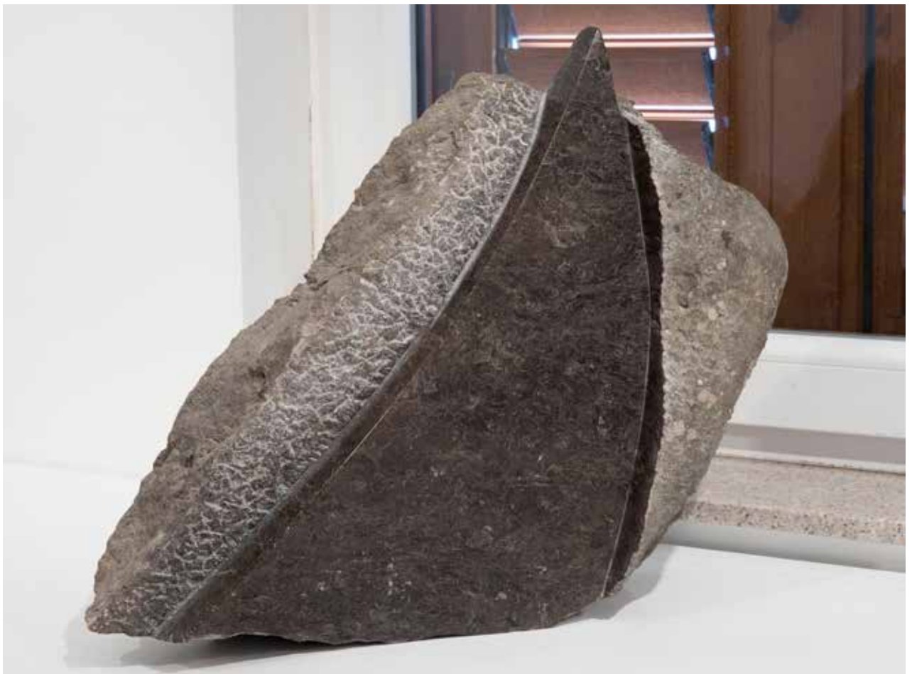
Senza titolo, 2004, pietra nera/ črn kamen, 45x54x15cm