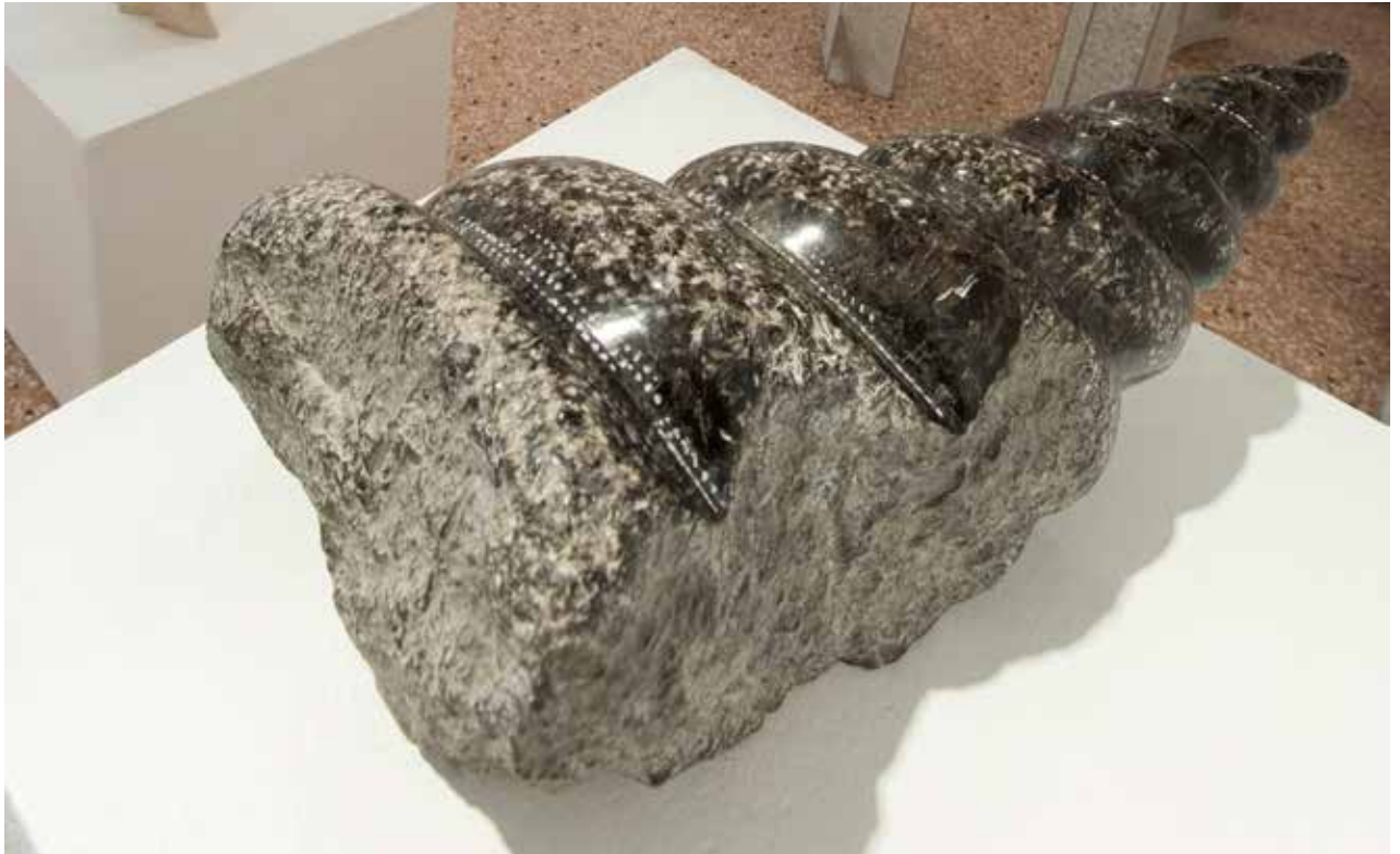
Conchiglia, 2008, pietra di Kopriva/ koprivski kamen , 13x42x17cm