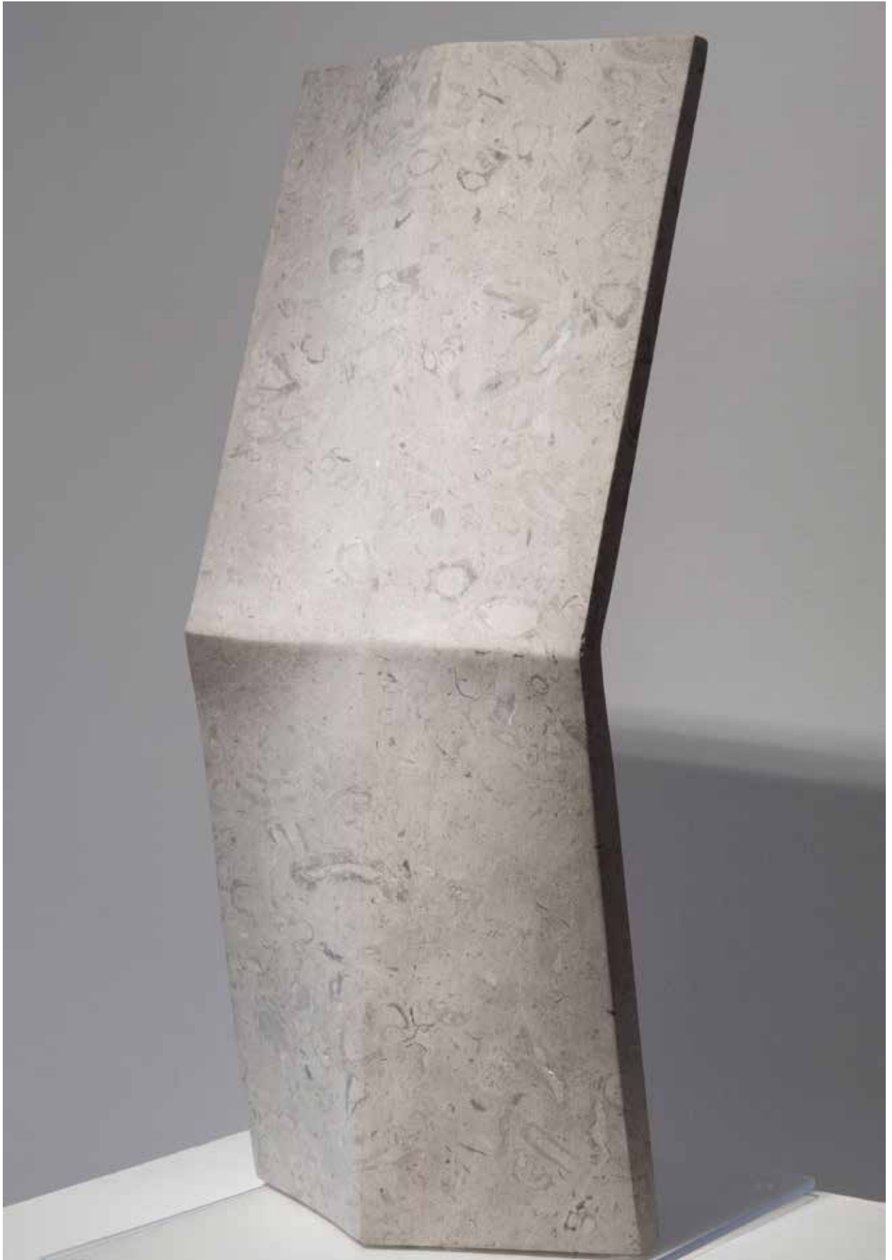
Bora, 2017, pietra di Lipizza/ lipiški kamen, 50x20x9cm