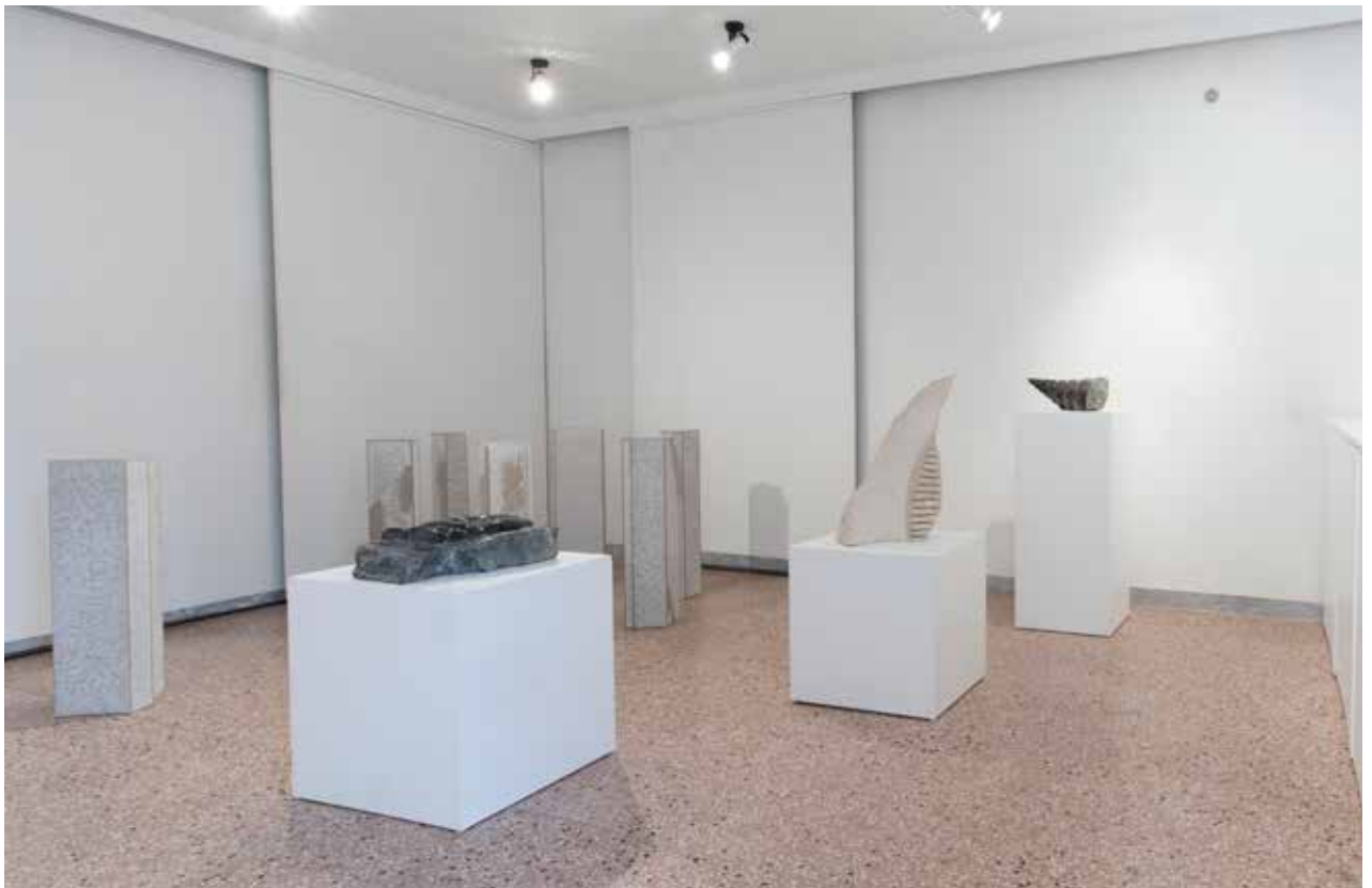
Senza titolo, 2002, pietra nera del Carso/ črn kamen s Krasa, 45x34x13cm