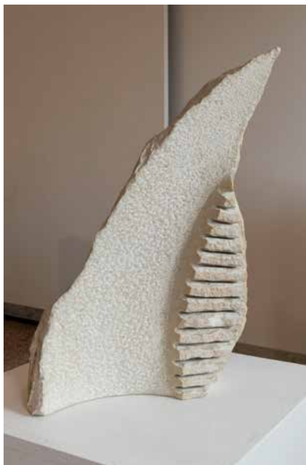
Vento e cipressi, 2008, pietra d Istria / istrski kamen, 36x55x11cm