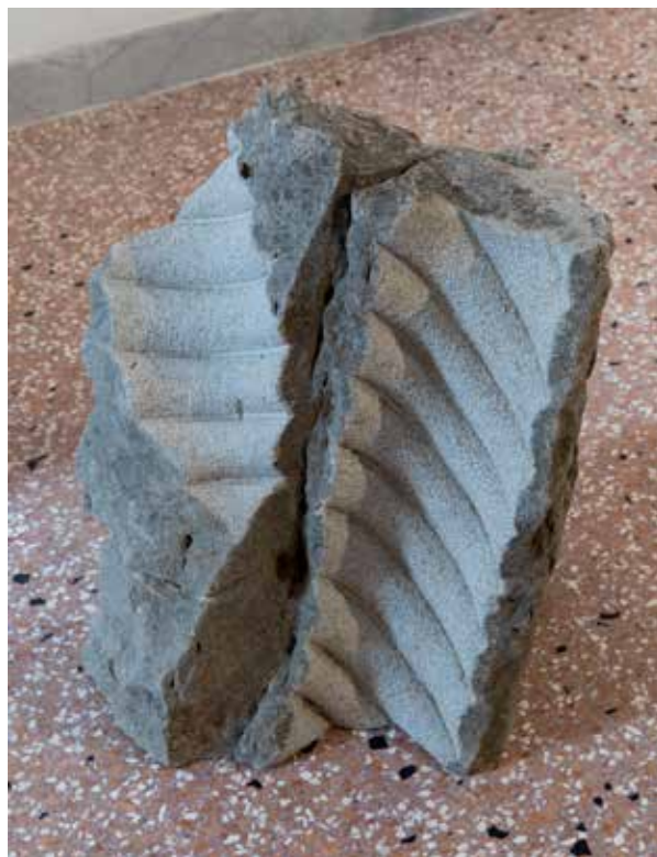
La luna e l mare, 2014 pietra calcrea/ apnenec, 44x35x24cm