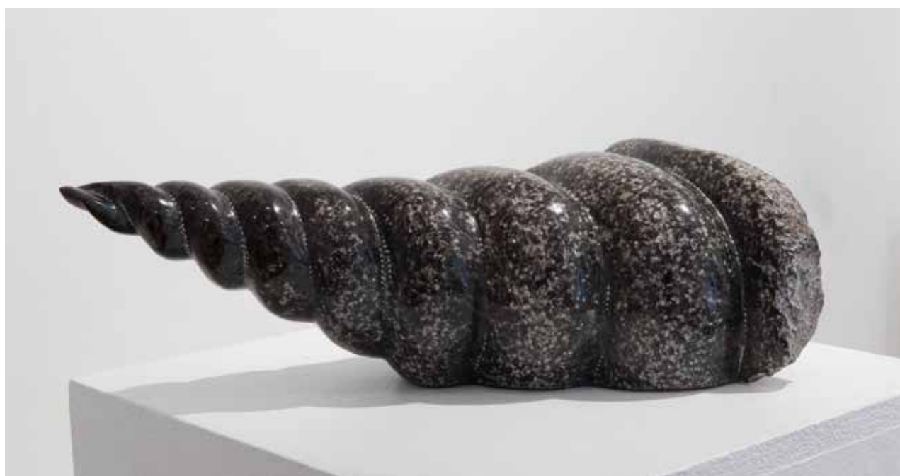
Conchiglia, 2008, pietra di Kopriva/ koprivski kamen , 13x42x17cm

Naša družba je v poznem 20. stoletju in še posebno v 21. stoletju neskončnost zanemarila, mogoče celo zavrgla, izločila iz svojih predstav. Celotno v znanstvenem okolju je neskončnost postala zgolj simbol v obliki ležeče osmice, ki pomaga pri izidu zapletene enačbe. Z ilustracijo zidu, meje vidnega vesolja, torej tistega, kar bi bilo v idealnih okoliščinah največja oddaljenost, do katere bi človek lahko kdaj koli potoval, s končno mejo vidnega vesolja je tudi vesolje izgubilo svojo neskončnost in nedoumljivost. To je duhovno siromaštvo, ki preveva postmodernizem in tudi sodobno umetnost, ki mu Svojc očitno ni podlegel. Sodobna umetnost je v resnici umetnostno-zgodovinski slog, ki ima zelo jasno določljiva pravila. Moderna umetnost se je z novim pogledom in značilnim načinom produkcije in forme, sledila razvoju tehnologije in filozofije, ločila