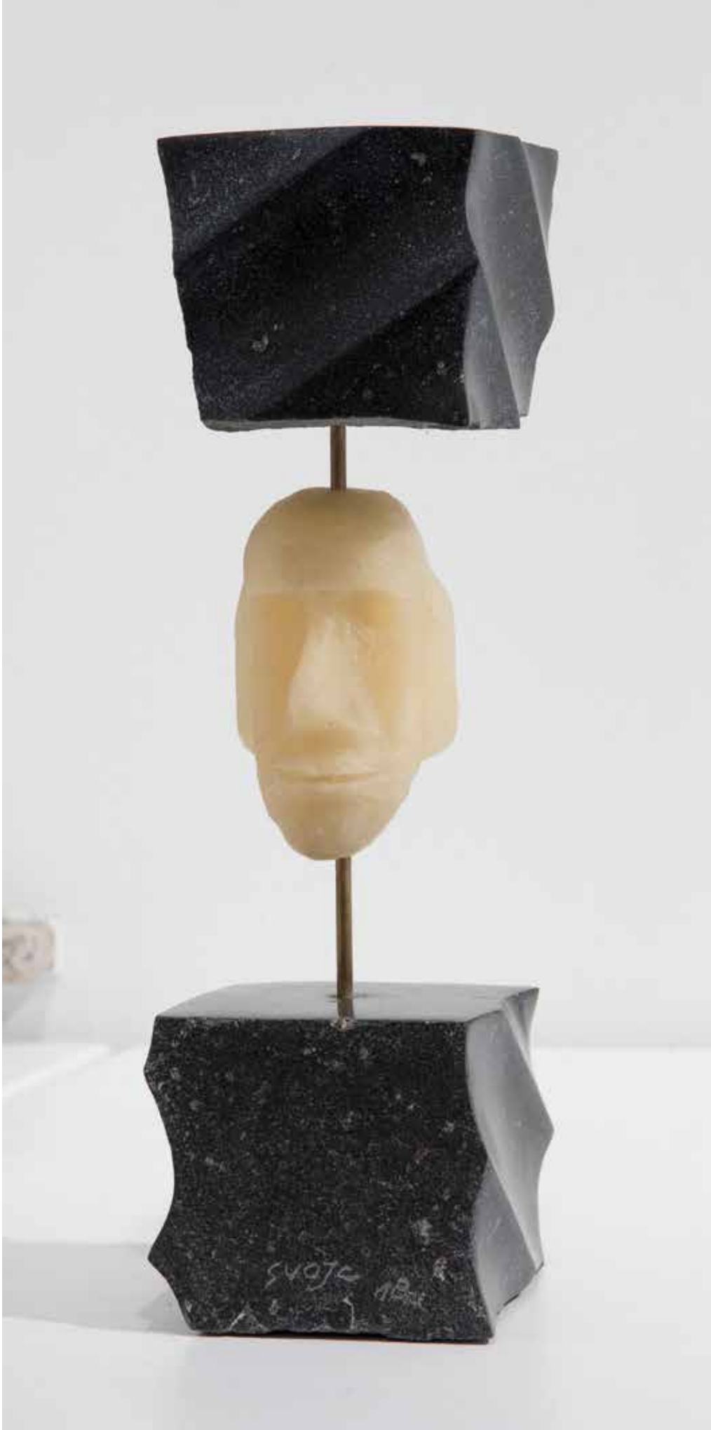
Pensiero 2, 2019, basalto, rame e cera / bazalt, baker in vosek, 9x29x9cm