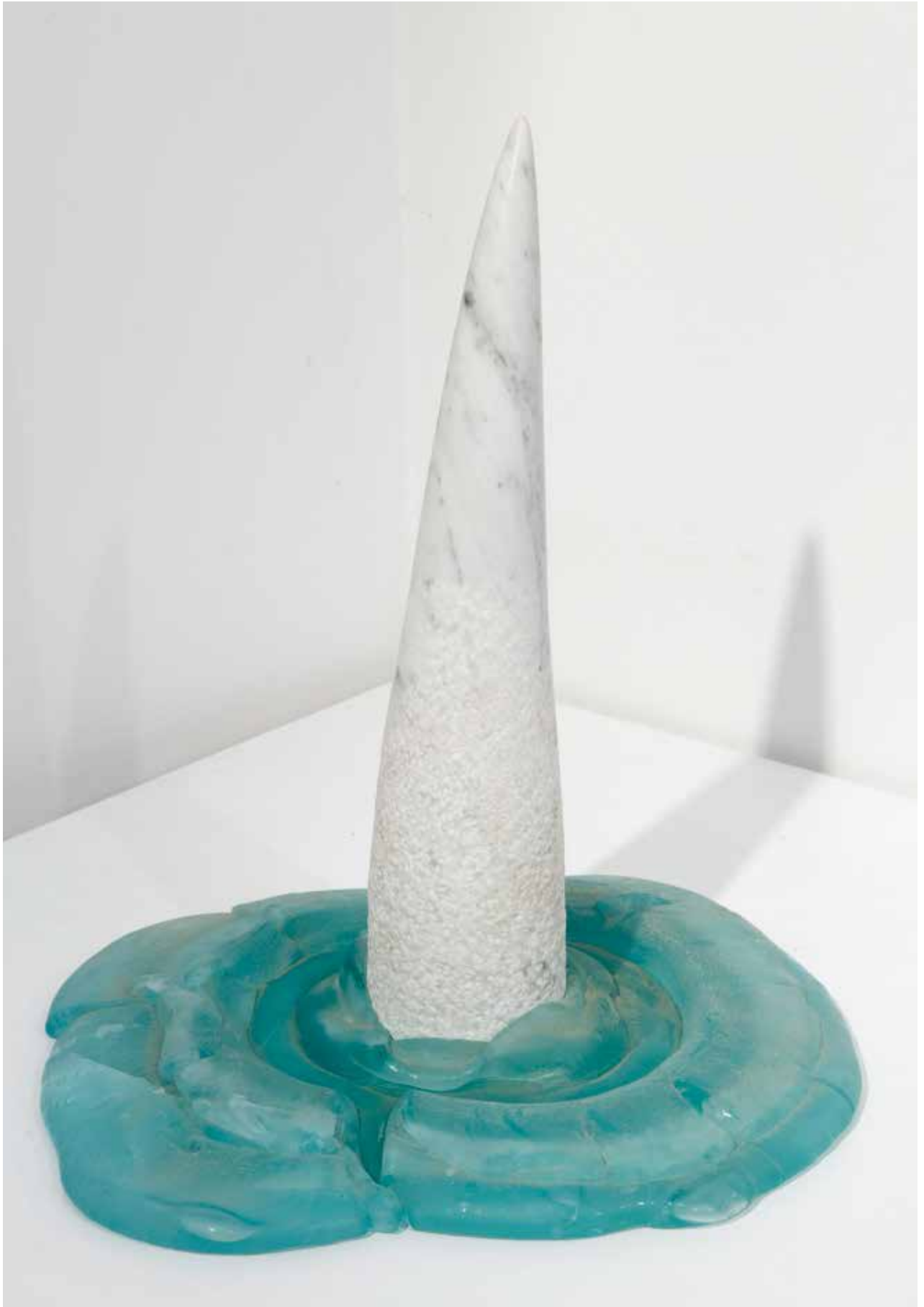
Germoglio, 2006, pietra e vetro fuso/ fuzijsko steklo , 35x31x34cm